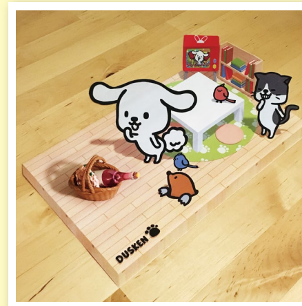
てまえ お さつえいれい (手前にミニチュアを置いた撮影例)