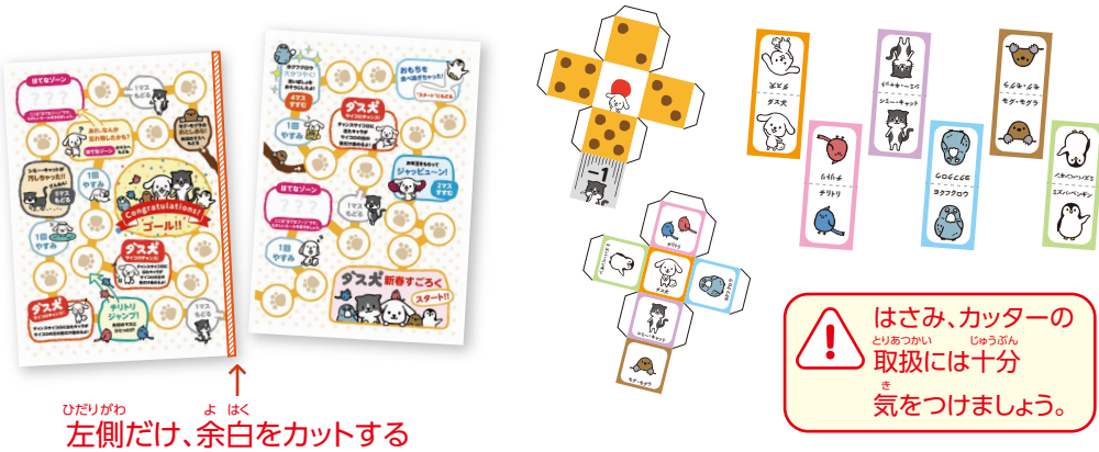
左側だけ、余白をカットする

厚手のプリンター用紙(ペーパークラフト専用紙など)に印刷し ハサミやカッターなどでカットします。遊戯盤は、あとで2枚をつなぎ合わせ ますので、図のように左側だけ余白をカットしてください。